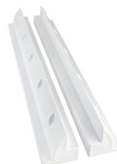
Halter-Set 550 mm EMO10072