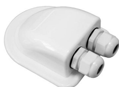
2-Wege Kabeldurchführung EMO10067