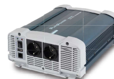
PPI 1500 PPI 2000